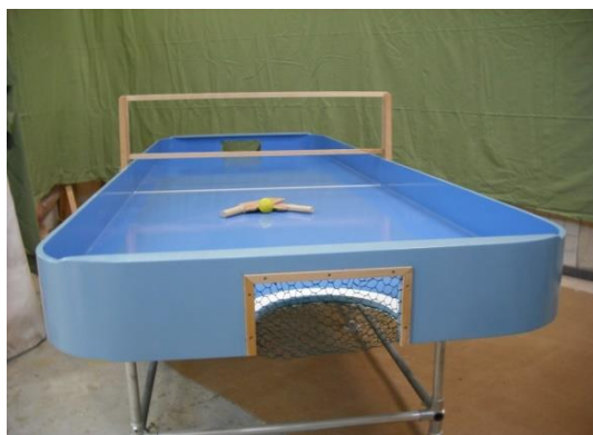
TABLE DE SHOW-DOWN

2 PLACE JEAN SANS TERRE 86000 POITIERS sur rendez-vous avec Yannick HERAUD 06-17-89-05-62